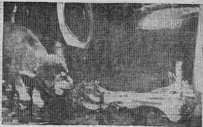
QUE HUESOTE — Es natural que un perro trate de enterrar un hueso y luego lo saca cuando tiene ganas de comer. Pero en Allan, Georgia, este perro encontró este hueso grande detrás de un restaurante y no sabe donde enterrarlo, pues no encuentra un lugar suficientemente grande para guardarlo.

Se daría con esto un gran paso en el aspecto cultural y daría ocasión a muchas señoritas santanecas para lograr perfeccionarse en esta disciplina artística.